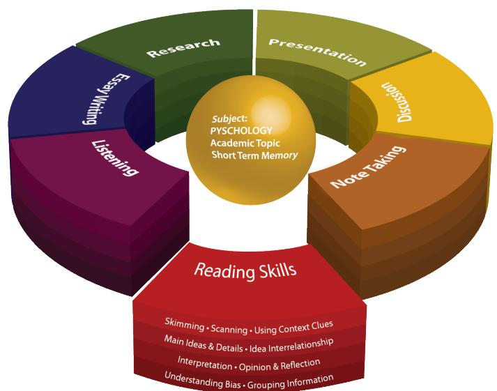
Ilustración gráfica de una unidad de aprendizaje de un programa LEAP de una semana